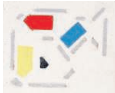
▲ 'Bok' (boven) en 'Vis' van Stijlkunstenaar Bart van der Leck.