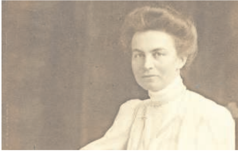
▲ Helene Kröller-Müller