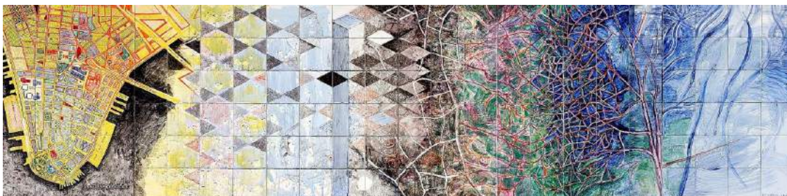
Transformatie, een groot tegeltableau bestaande uit 144 tegels, van kunstenaar Chris Dagradi, verwijzend naar de Twin Tower catastrofe op 11 september 2001 in New York.