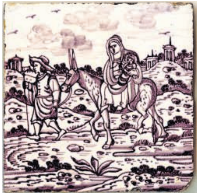
◀ Tegel 'Vlucht naar Egypte'.

■ De winnaar van de Edison Klassiek Publieksprijs wordt zondag bekendgemaakt. Een aantal winnaars ontvangt de Edison tijdens de live uitzending van Podium Witteman om 18.05 uur op NPO 2. De genomineerden staan op Edisons.nl . 22 februari spelen Holland Baroque en Eric Vloeimans Carousel live in Nijmegen.